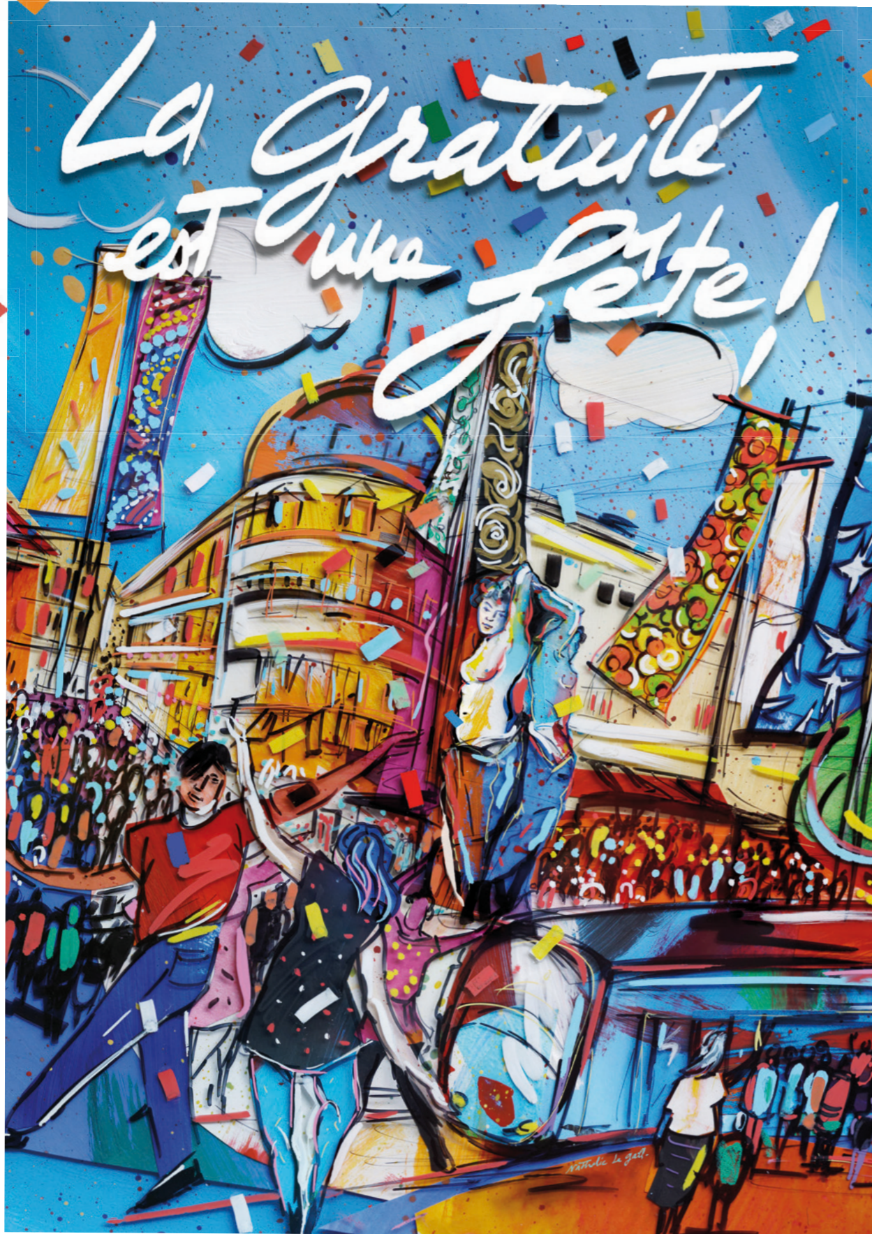
Illustration : Nathalie Le Gall

Montpellier Méditerranée Métropole - Direction de la Communication - 11/2023