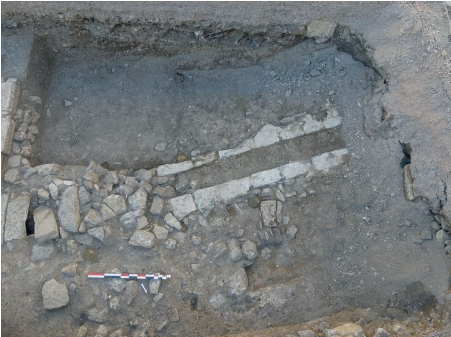
Une canalisation mise au jour