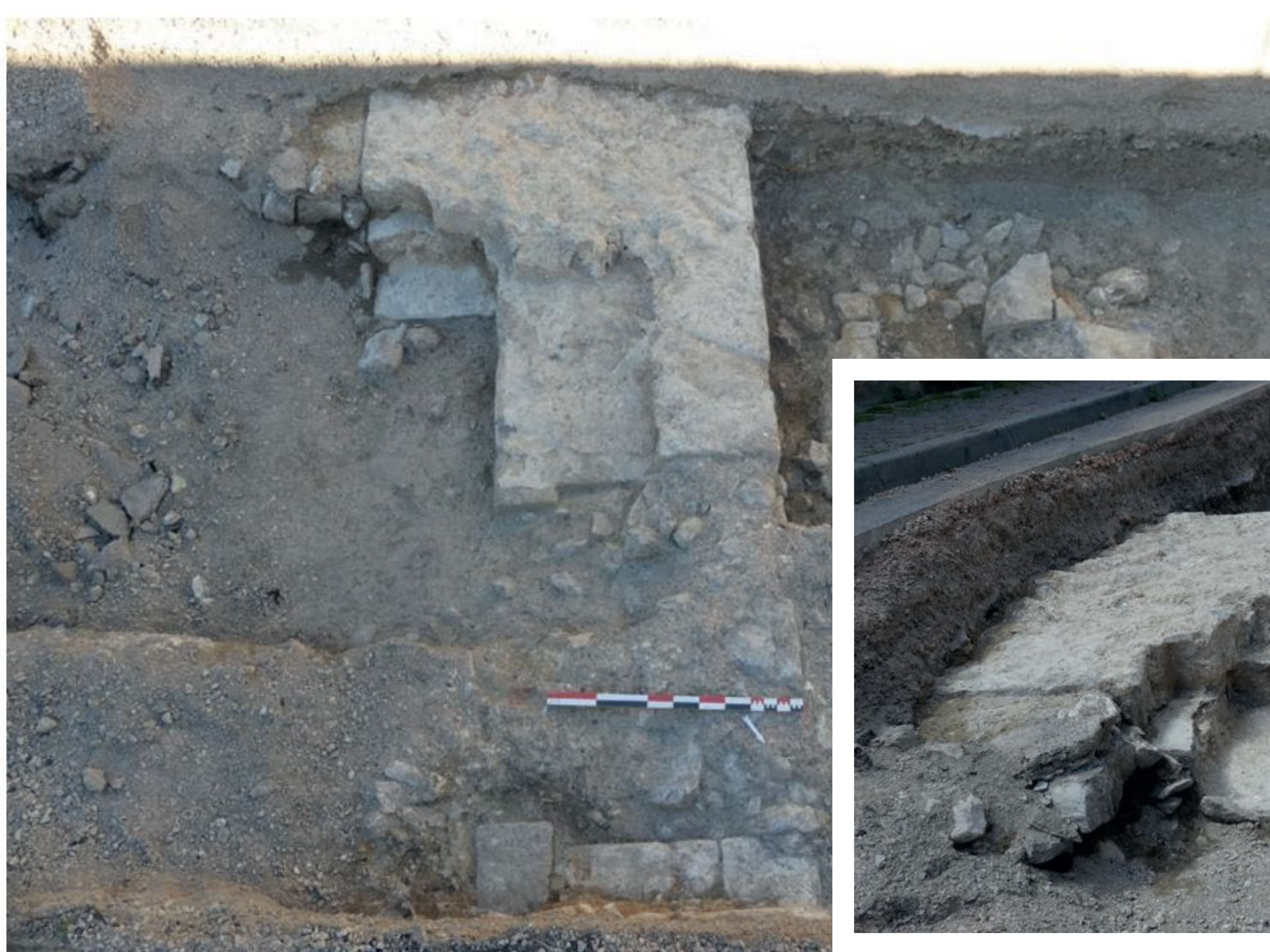
Les restes du rempart dans la tranchée 1.